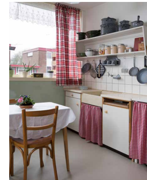
1956 Nieuwe Bouwen Huis Polman, Nagele Museumhuis