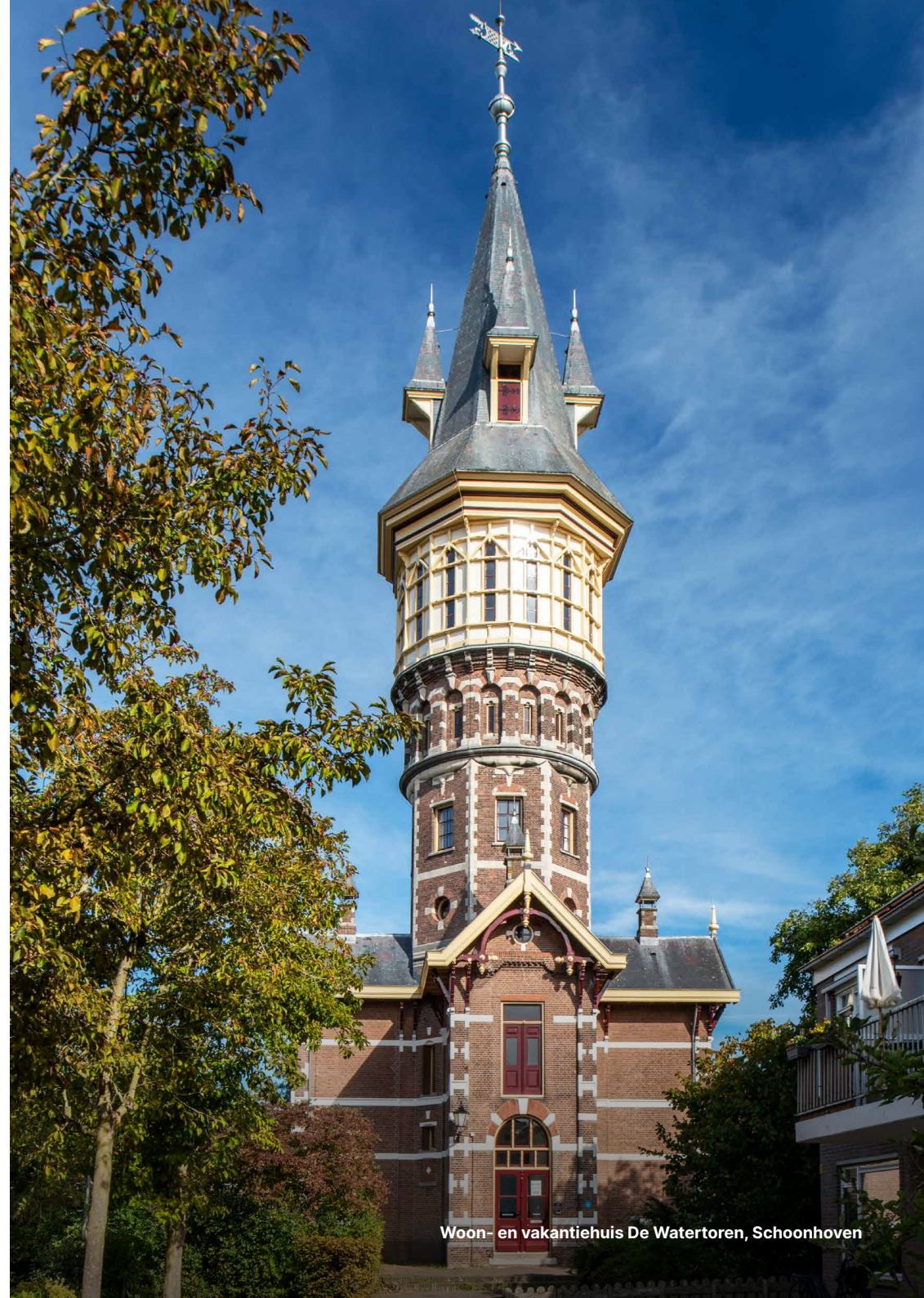
Woon- en vakantiehuis De Watertoren, Schoonhoven