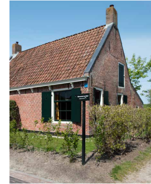
1835, Het Vissershuisje Moddergat Overnachten