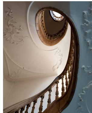
1746 Rococo Huis Timmerman Monnickendam Werken