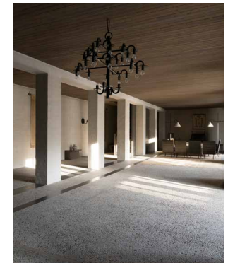
1967 Bossche School Huis Jan de Jong, Schaijk Wonen, werken