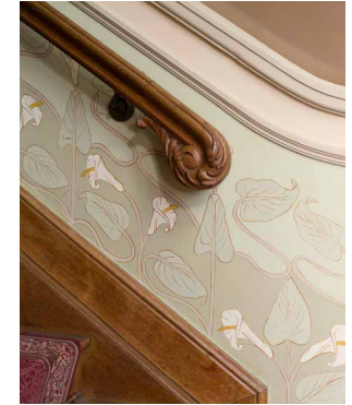
1899 Art nouveau/eclecticisme, Villa Rams Woerthe, Steenwijk Museumhuis, evenementen