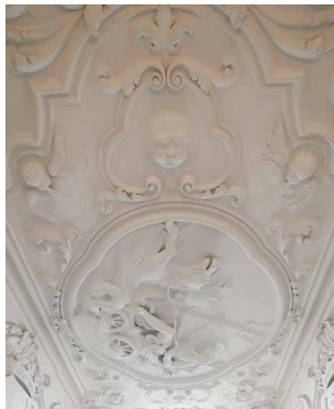
1726 Lodewijk XIV-stijl, Gemeenlandshuis, Amsterdam Werken