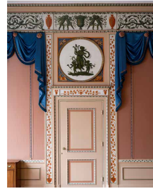
1808 Empire, Huis Barnaart, Haarlem Museumhuis, werken