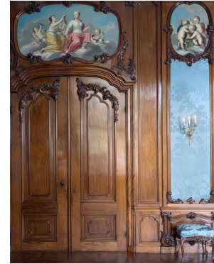
1755 Rococo Huis Bartolotti, Amsterdam Museumhuis, evenementen