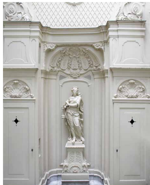
1728 Lodewijk XIV-stijl Huis van Brienen, Amsterdam Wonen