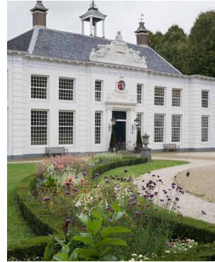
1717 Lodewijk XIV-stijl, Buiten- plaats Beekestijn, Velsen-Zuid Museumhuis, evenementen