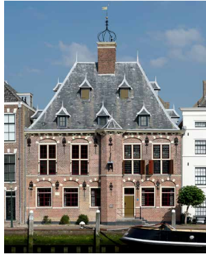
1626 Renaissance Gemeenlandshuis, Maassluis Werken