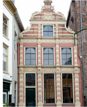
1571 Renaissance Karel V-Huis, Zwolle Wonen, werken