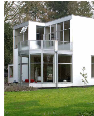
1935 Nieuwe Bouwen Huis Hildebrand, Blaricum Wonen