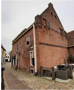
1400 Gotisch Krommesteeg 11 Elburg Werken