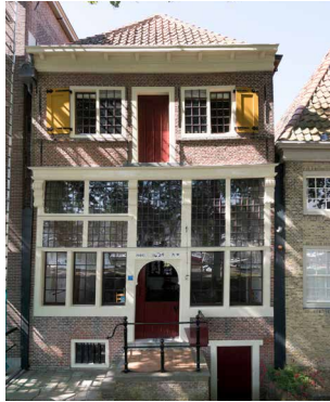
1624 Renaissance Huis Bonck, Hoorn Wonen