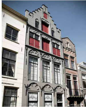
1495 Gotisch Het Zeepaert, Dordrecht Wonen