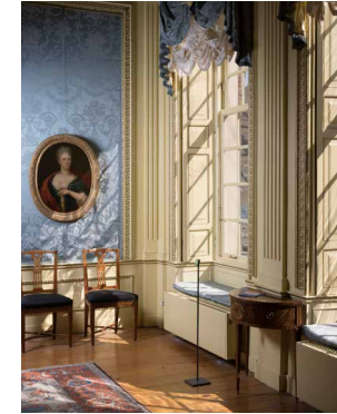
1781 Neoclassicisme, Huis Van Eysinga, Leeuwarden Museumhuis, wonen, werken